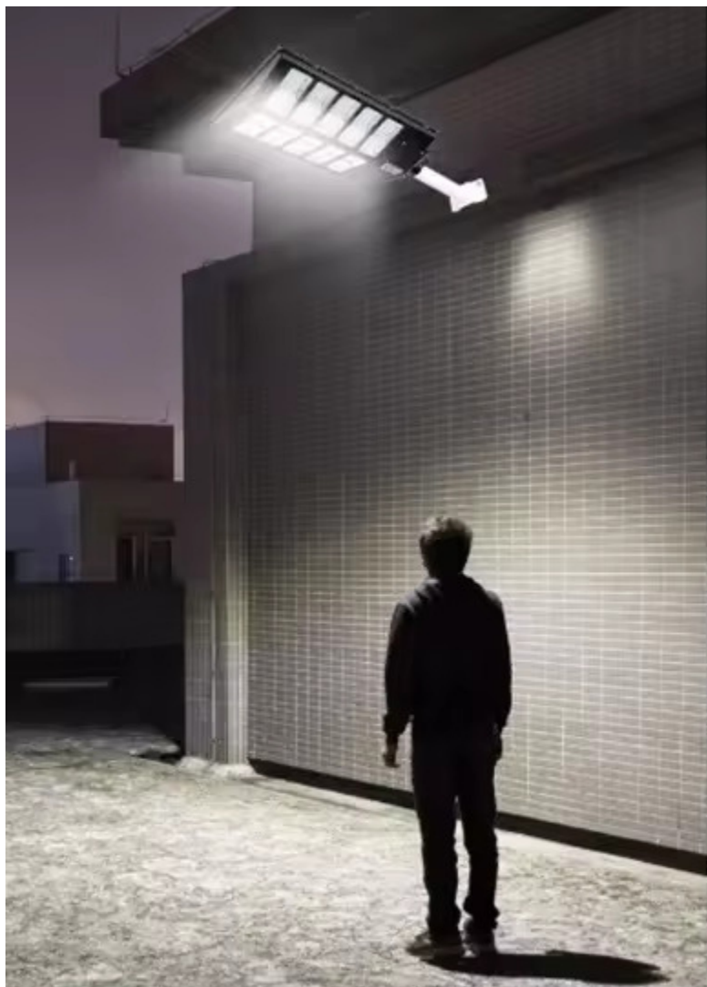
LUMINA PUTERNICA CAND ESTE DETECTATA MISCARE

luminozitate redusa pentru a economisi energie. Senzorul de lumina integrat permite lampii sa se aprinda automat la lasarea intunericului si sa se stinga in timpul zilei, asigurand astfel o utilizare eficienta si economica.