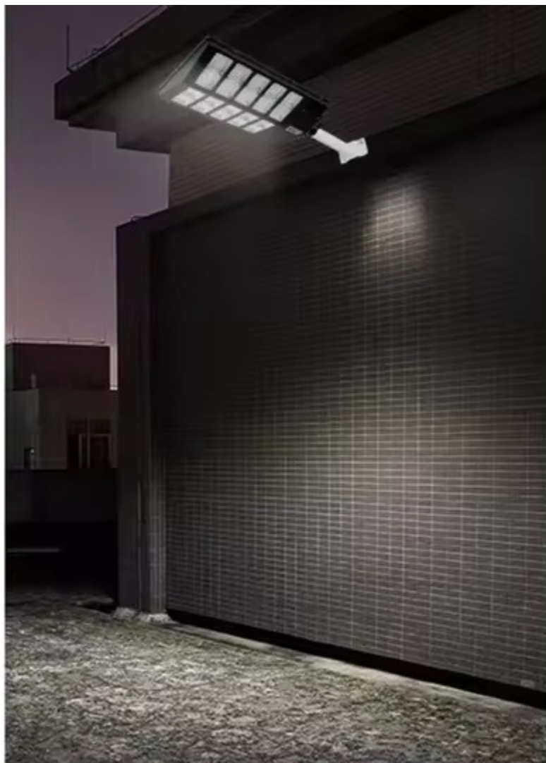
LUMINA DIFUZA CAND MISCAREA NU MAI ESTE DETECTATA