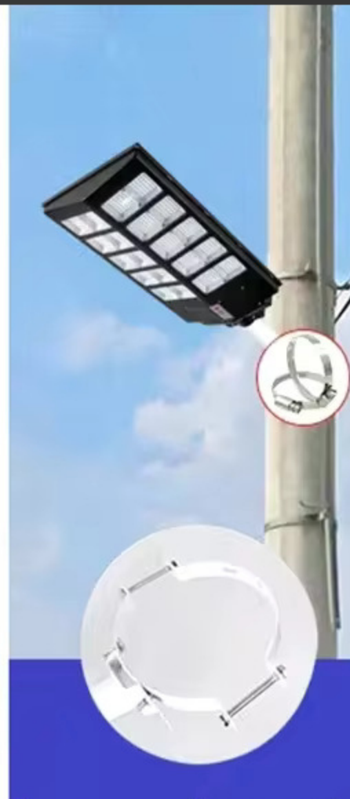
STALP DE ILUMINAT