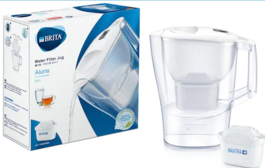
Cana filtranta de apa Brita Aluna

2.4 L, alb-transparent + filtru Maxtra Plus 97,00 lei 69,98 lei