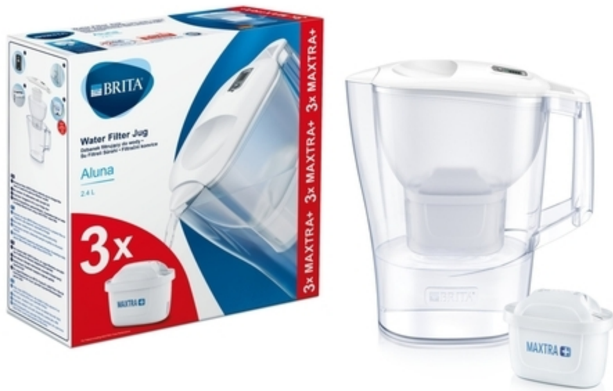
Cana filtranta de apa Brita

Marella 2.4 L, alba + 3 filtre rezerva Maxtra Plus 145,00 lei 109,00 lei