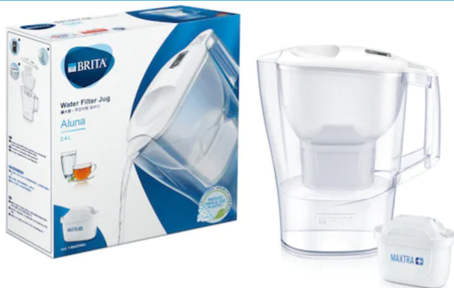
Cana filtranta de apa Brita Aluna

2.4 L, alb-transparent + filtru Maxtra Plus 97,00 lei 69,98 lei