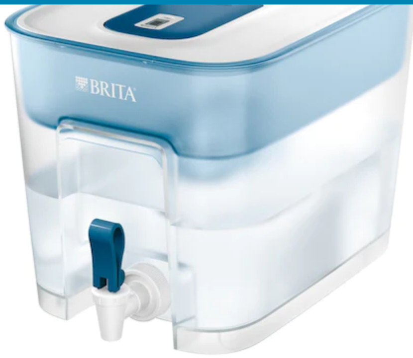
Dozator de filtrare apa Brita Flow

8,2 l + filtru Maxtra Plus 259,00 lei 149,00 lei